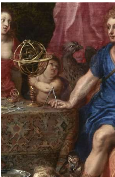
Hendrick van Balen et Jan I Brueghel l'Ancien, Allégorie des Cinq Sens (détail), Huile sur bois, collection particulière

Dans les œuvres de Jan I Brueghel et d'Hendrick van Balen, on trouve une multitude de détails faisant référence aux grandes découvertes du 17 e siècle : instruments scientifiques, botanique, objets rares... Et pour cause, les ateliers de ces deux artistes étaient établis à Anvers. Cette ville constitue le carrefour d'exportation et du commerce international de toutes sortes de merveilles venues du monde entier. Les peintres ont probablement eu l'opportunité de découvrir ces trésors et de s'en inspirer pour les glisser dans leurs œuvres. Les élèves partent à la recherche de ces détails et plongent dans le siècle fascinant de Jan I Brueghel et Hendrick van Balen à travers l'Histoire, l'économie et les sciences.