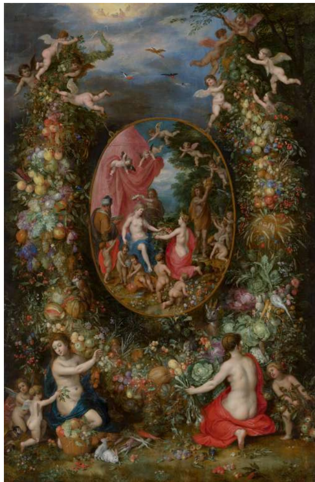
Hendrick van Balen et Jan I Brueghel l'Ancien, Guirlande de fruits entourant une représentation de Cybèle recevant les cadeaux des allégories des Quatre Saisons , huile sur bois

Grâce à de nombreux prêts des plus grands musées européens et de collections particulières, le musée de Flandre reste ainsi fidèle à la ligne qu'il s'est fixé de mettre en lumière les artistes oubliés. Au travers la relation qu'il a nouée avec Brueghel, l'Œuvre de Hendrick van Balen sera remise à l'honneur.