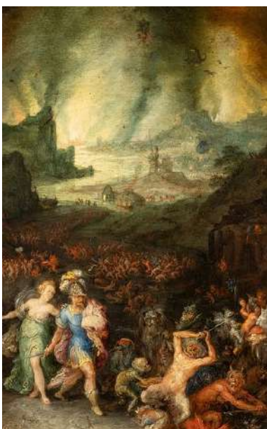
Jan I Brueghel l'Ancien, Enée et la Sybille aux Enfers (détail), huile sur cuivre, Budapest, Museum of Fine Arts

Dans les œuvres de Jan I Brueghel et de Hendrick van Balen, on rencontre une multitude de personnages issus de la mythologie, de la Bible mais aussi de la vie quotidienne. Toutes ces scènes se déroulent dans des paysages plus ou moins réels. Dans ces œuvres, le paysage joue un rôle important dans l'expression des émotions du spectateur. Les élèves partent à la découverte des univers représentés par les deux artistes et questionnent les émotions évoquées dans les œuvres, la portée symbolique du monde et le rapport qu'entretient l'Homme avec la Nature.