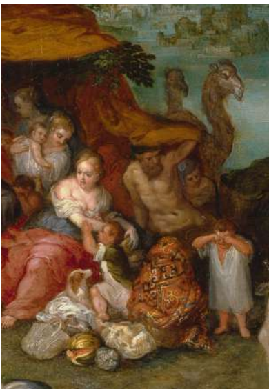
Jan I Brueghel l'Ancien, Le Déluge et l'Arche de Noé (détail), huile sur bois, Zurich, Kunsthau

Hendrick van Balen et Jan I Brueghel vivent à Anvers au début du 17 e siècle, une ville qui constitue le carrefour où s'acheminent toutes sortes de merveilles venues du monde entier. Les peintres ont probablement eu l'opportunité de découvrir ces trésors et de s'en inspirer pour les glisser dans leurs œuvres. À la manière d'une expédition scientifique, les élèves sont invités à voyager au cœur du 17 e siècle et à explorer les curiosités des différents continents : fruits et légumes rares, objets de vaisselle, animaux exotiques et bien d'autres trésors.