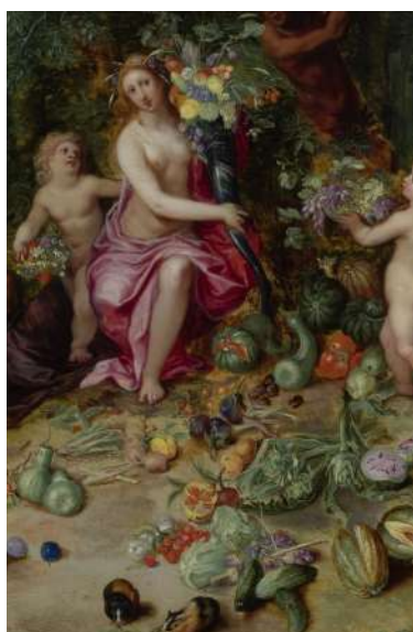
Hendrick van Balen et Jan I Brueghel l'An-ancien (d'après) Allégorie de la Terre (détail), Huile sur bois

En visitant l'exposition « Brueghel et Van Balen : artistes et complices », Suzon l'écureuil a découvert un magnifique tableau. Il représente les dieux de la