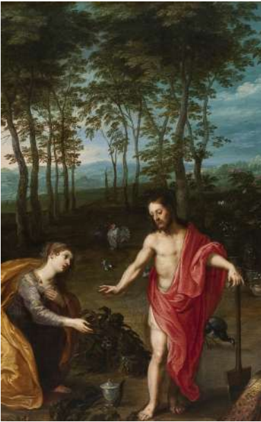
Hendrick Van Balen et Jan I Brueghel l'Ancien, Le Christ jardinier (détail), huile sur bois, Paris, Musée des arts décoratifs

Jan I Brueghel et Hendrick van Balen, deux peintres talentueux et amis proches, ont connu un immense succès au début du 17 e siècle.