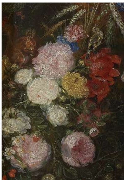
Hendrick van Balen et Jan I Brueghel l'An- cien, Vierge à l'Enfant dans une guirlande de fleurs (détail), huile sur bois, Madrid, Musée national du Prado © Photographic Archive Museo Nacional del Prado.

Chaque fois que Suzon l'écureuil passe la tête par le creux de son arbre, elle admire le spectacle de la nature. Elle emmène les enfants à la découverte des saisons dans les œuvres du musée. Accompagnés de ce petit guide,